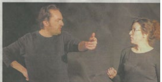
Le spectacle « La petite gorgée » se jouera en octobre à la médiathèque Toussaint à Angers.

Le pianiste Pierre-Yves Plat sera présent au festival les Rendez-vous de l'Éclat à Nantes le 30 août et au festival C'est l'air Jazz début septembre.